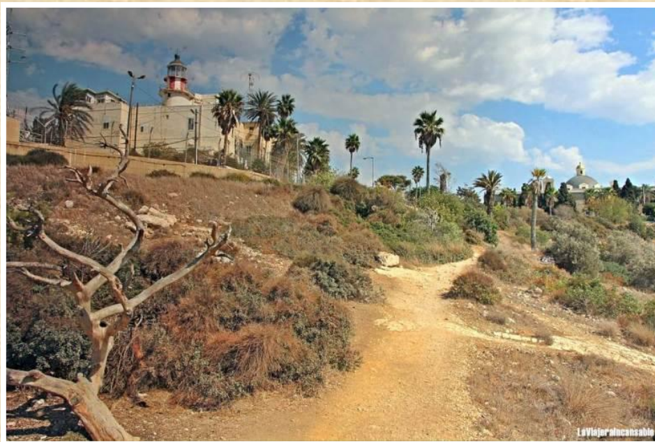
Vista del faro Stella Maris y, al fondo, la cúpula del monasterio / El faro está cerrado al público

El lugar en el que se halla actualmente el faro fue el palacio de verano de Abdullah Pasha , el que fuera dirigente de Acre de 1820 a 1831. La vivienda y el faro fueron construidos utilizando materiales del monasterio carmelita que el mismo Abdullah Pasha ordenó destruir. Años después, sin embargo, Ibrahim Pasha de Egipto capturó Acre, mandó a Abdullah al exilio y devolvió el edificio a los Carmelitas.